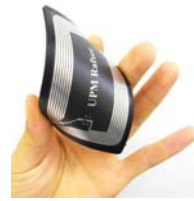
UHFソフトモールドタグ