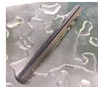
水に強いスティックタグ