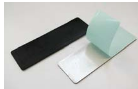
UHFソフトモールドタグ