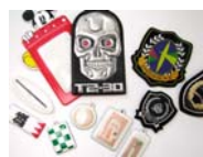
HFウエルダー加工タグ