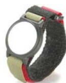
HFリストバンドタグ