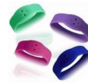
HFシリコンリストバンドタグ