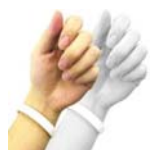
HFシリコンリストバンドタグ