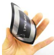
HFソフトモールドタグ