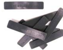
UHF耐熱シリコンタグ