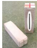
コンクリート埋設 取付例