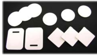
UHFソフトリネンタグ