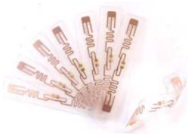
UHFソフトモールドタグ