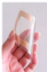
HFソフトモールドタグ