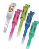
HFウエルダーバンドタグ